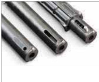
Different front attachment available Unterschiedliche Spindelseitige Aufnahmen

Außergewöhnliches und innovatives Design Kompakte Einbaumaße Integrierte Endlagenschalter